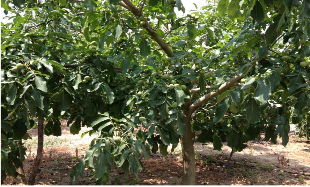
Chandler Ceviz Ağacı

Chandler ceviz bahçesi 5-6 yaşında iken 20-30 kg. , 10 yaşında iken 40-60 kg., 20 ila 60 yaşları arasında ise 80-150 kg. ürün verebilmektedir.